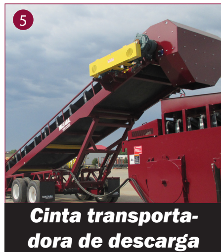
Cinta transportadora de descarga