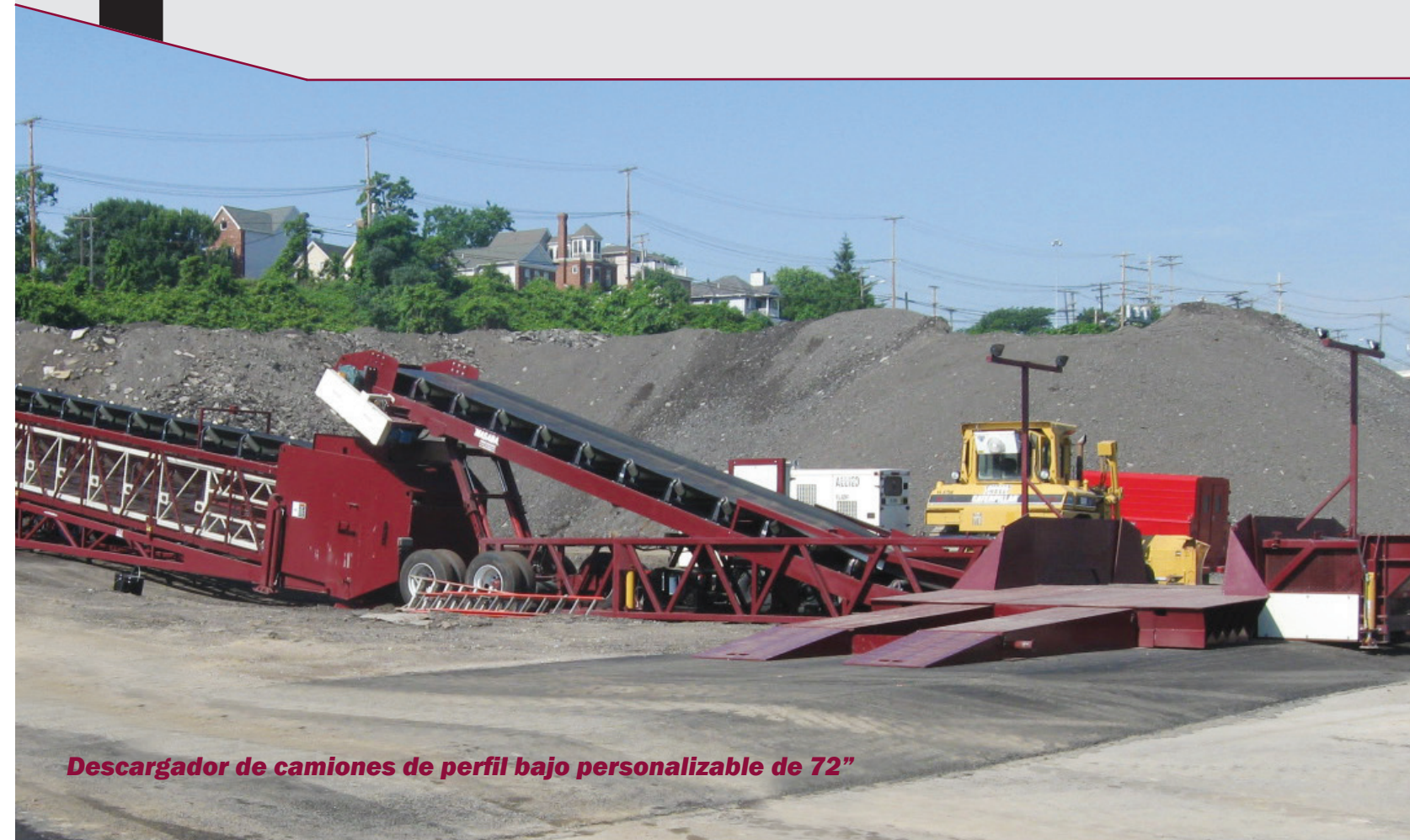
Descargador de camiones de perfil bajo personalizable de 72"

DESCARGADORES DE CAMIONES DE PERFIL BAJO